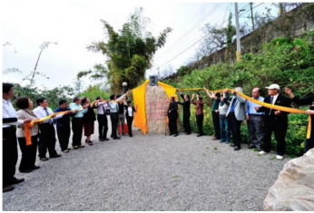
為大地董事&治史起造台灣國的張炎憲教授立碑 (2015年)

自 2010 年開始在園區舉辦 228 追思活動，追思台灣神的犧牲奉獻，喚起台灣人的民主意識。2013 年開始，舉辦各類的紀念活動，除了把園區當成教育場所，更舉辦象徵性的儀式，強調儀式的文化現象，及其背後保存記憶的莊嚴性與文化抵抗，以台灣主體的觀點來詮釋歷史事件與創造新的意義。