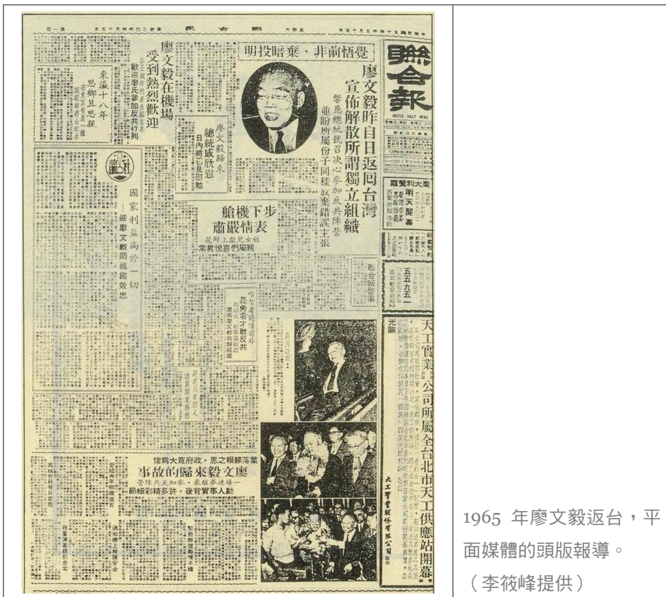
1965 年廖文毅返台，平面媒體的頭版報導。

然而 1960 年之後，組織內部問題浮現，國民黨趁機分化。此外國民黨逮捕廖家族親與台獨同志，判重刑威迫。允諾廖文毅回台的條件是：一、無條件釋放所有與台獨有關的政治犯；二、歸還被沒收的財產；三、政府給予相當的地位，如省府重要職務。