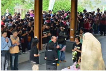
主儀人帶領儀式進行 (2013年)

自 2010 年開始在園區舉辦 228 追思活動，追思台灣神的犧牲奉獻，喚起台灣人的民主意識。2013 年開始，舉辦各類的紀念活動，除了把園區當成教育場所，更舉辦象徵性的儀式，強調儀式的文化現象，及其背後保存記憶的莊嚴性與文化抵抗，以台灣主體的觀點來詮釋歷史事件與創造新的意義。