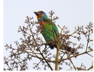
台灣擬啄木（五色鳥） 台灣特有種，留鳥。常駐於聖山聖殿前大草坡的大樟樹樹幹。

豐碩的生態物種，是園區的另一特色。有些物種的生態習性或棲地環境，需要無污染的大自然或人為干擾較小的棲地，尤其是能提供豐富的食物來源之處，聖山除了符合這些綜合的因素，尊重一草一木，與自然共存的環境態度，並以相信自然之中另有一個世界的「道在自然」，秉持以平常心欣賞萬物、尊重生命，當可以自由來去的蛙類和鳥類等動物逐漸現身，顯示生物安心居住於園區。