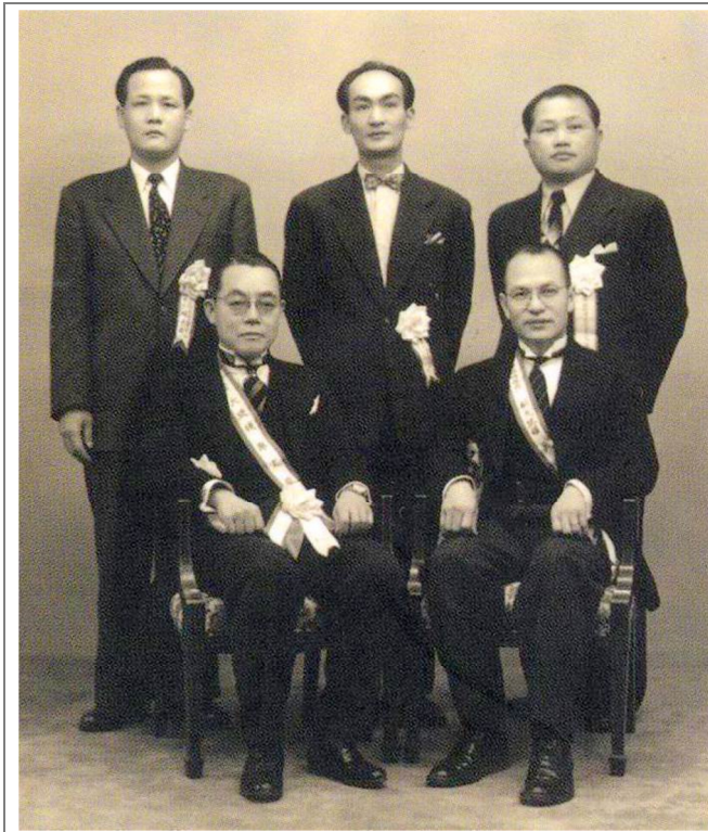
1956 年台灣共和國臨時政府成立，前排左為大統領廖文毅。

世界聯邦舉行的亞細亞會議，1952 年與 1954 年的 11 月，分別在廣島與東京召開，廖文毅皆率團參加，提出「讓台灣人民投票決定前途」的訴求。1955 年 4 月在印尼萬隆進行的亞非會議，廖文毅透過印尼首相，表達蔣政權非法佔領台灣實行獨裁統治，只有台灣獨立，亞洲才有和平的論點。