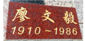
台灣神追思牆上的 台獨啟蒙者廖文毅

廖文毅（1910—1986），雲林西螺人，台灣共和國臨時政府大統領，台灣獨立運動的先聲。