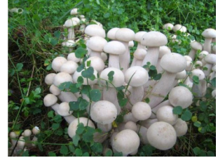
雞肉絲菇 又稱蟻巢傘，野生食用菌，無法人工栽培，與白蟻有共生關係。常出現於 4-6 月的大雨過後。常見於聖山離農田不遠的草地。