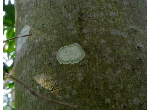
地衣原葉體（簡稱地衣） 整體形態呈圓形，以圓周方式向外擴張，是真菌跟藻類的共生體，表面的藻類可以行光合作用製造養分；下方的真菌的菌絲則吸收水分與礦物質。 地衣對環境的適應力強，弱點則是對空氣污染敏感，此致命點正可作為空汙指標。於聖山的九分福地喬木發現。