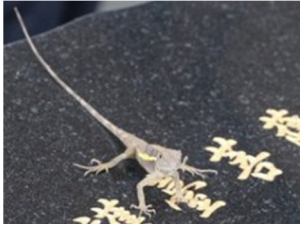
斯文豪氏攀蜥 俗稱肚定（台語），台灣特有種，台灣攀蜥中體型最大的種類。特色是領域行為明顯，藉由持續做出伏地挺身動作，將喉部擴張來宣示領域。聖山全山常見。