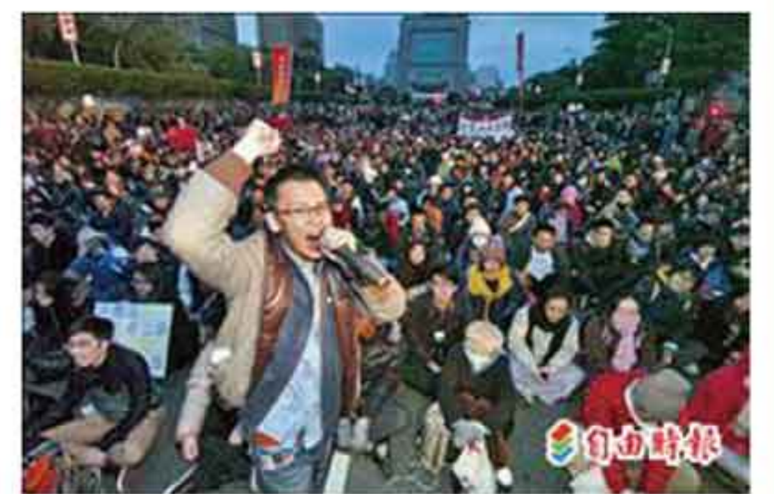
反媒體巨獸青年聯盟2000學子守夜抗議，最動人、最有力、最難過的跨年風景.....